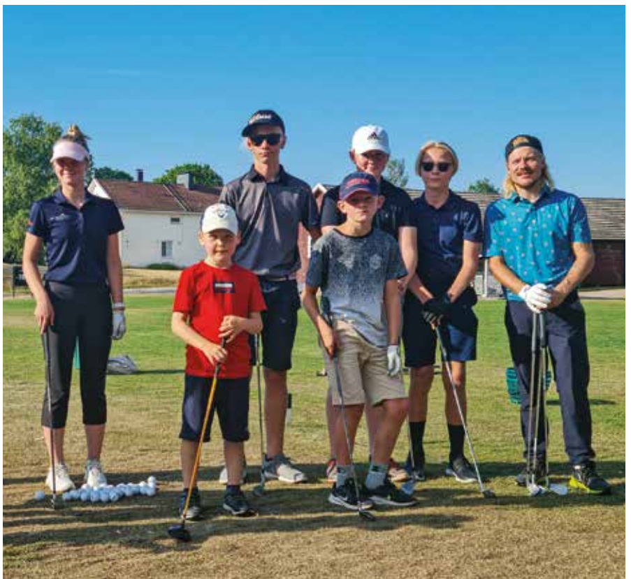
”Junnujen harjoituksissa kävi viime kesänä vieraana räp-duo JVG:n VilleGalle.”